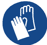
Guantes de protección

Selección del material de los guantes en función de los tiempos de rotura, grado de permeabilidad y degradación.