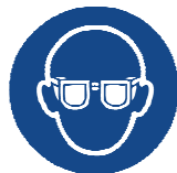
Lunettes de protection hermétiques